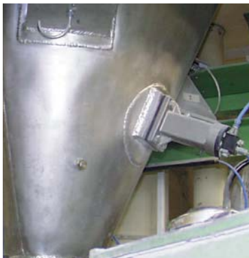
Czyszczenie ścianki zbiornika