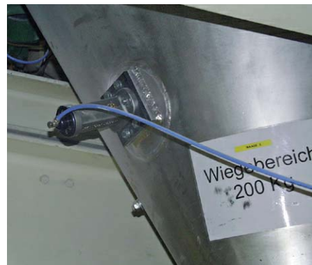
Czyszczenie zasobnika wagowego